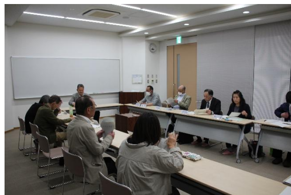
( 運営委員会の様子 )