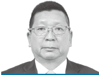
藤居 吉也 議員