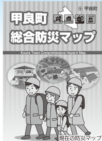
現在の防災マップ

最新の情報に合わせ、河川等の流水を流下させる能力を超える洪水であっても町民の生命を守り、甚大な被害を回避するため作成される。10月末に原案作成・公表。