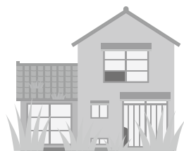
甲良町空家住宅等除却支援事業補助金交付要綱

特定空家の除却支援としては、対象経費の5分の1、上限50万円を補助。特定空家以外の空家は除却費用の20%、40万円が上限です。実績として令和6年1件、令和7年に2件となっている。