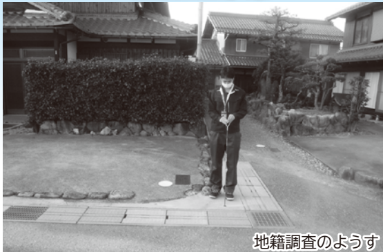
地籍調査のようす

現在、法務局にある公図（地図）は、大半が明治時代の作成で境界や形状などが現実とは異なっている場合が多い。地籍調査が実施されることにより、法務局の登記簿記載が修正され公図（地図）更新される。現在、金屋地区が実施中。