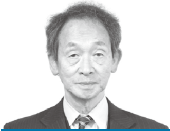
木村 修 議員