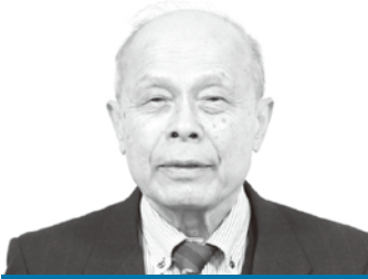
西澤 伸明 議員