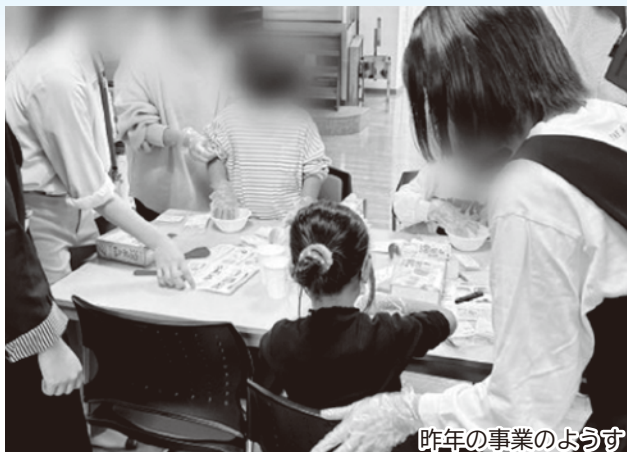
昨年の事業のようす

令和7年度に実施した就学前の子どもへの保護者に対する調査においても、学力向上支援施策や相談支援、保護者間の交流支援等のニーズが示されたことから、本事業を継続的に実施する。