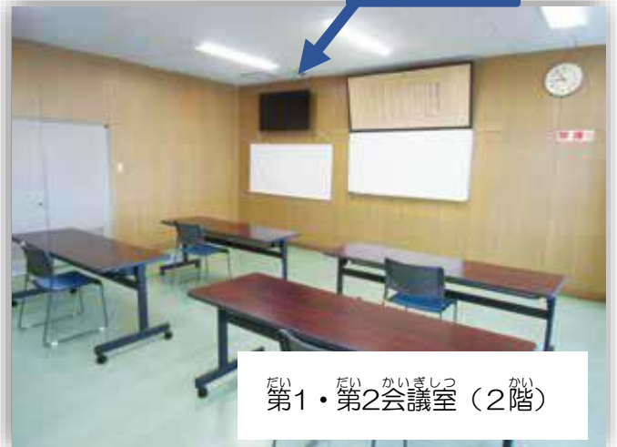
だい だい かいぎしつ かい 第1・第2会議室 (2階)