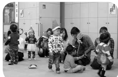
昨年度の様子。楽しく遊んでいます。

今年度も6月から「親子ふれあい教室」を開催します。0才児、1才児、2・3才児の年齢別の教室です。年齢に合わせた楽しい親子遊びや工作、育児に関するお話などを計画しています。教室に参加することでお子さんもお母さんもお友達ができます。みんなで子育てを楽しみましょう。教室の案内は、全戸配布しています。