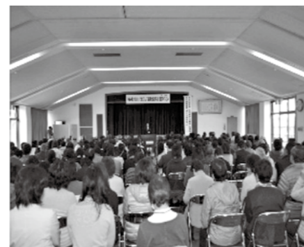
満席の会場で聴講される参加者の皆さん