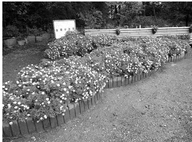
最優秀賞 金屋少年団