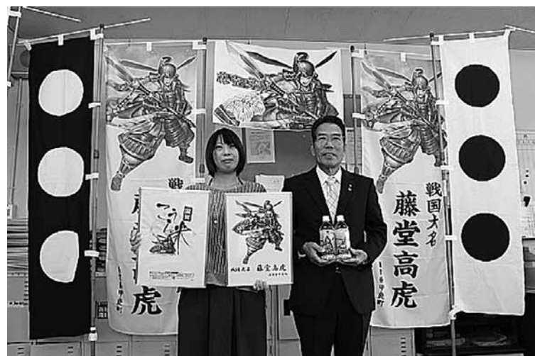
報道発表（彦根市役所内にて）