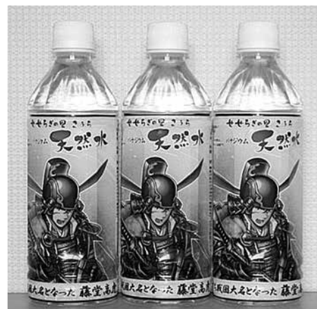
【せせらぎの里こうら天然水】