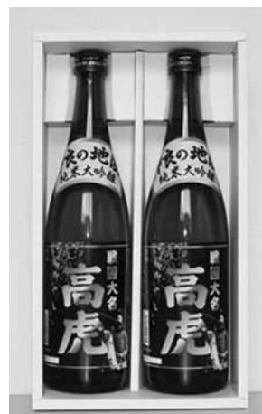
【純米大吟醸「戦国大名高虎」】