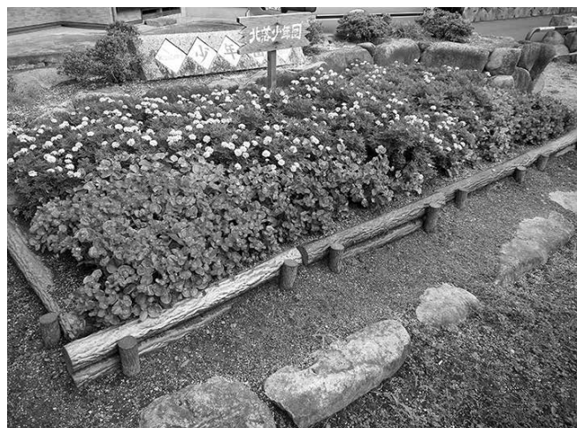
優秀賞 北落少年団