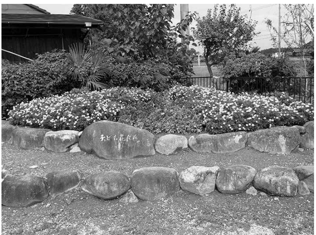
優秀賞 正楽寺少年団