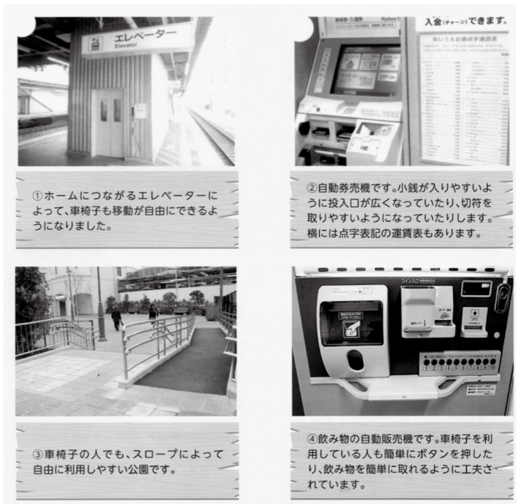
①ホームにつながるエレベーターによって、車椅子も移動が自由になりました。

事例として、「講演会や研修会などを主催する際に、聴覚障がいのある人のために、手話通訳や要約筆記を行う」などがあげられます。