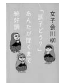
『女子会川柳』ポプラ社

遺言は愛する家族へのラブレター。クスリと笑えて、ホロリと泣ける。日本全国58496通の応募の中から厳選した遺言川柳を紹介。