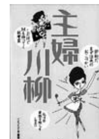
『主婦川柳』イオンスクエア編集部/著 宝島社

ごぞんじ!第一生命「サラリーマン川柳コンクール」の応募作品から選ばれた優秀作360句を収録。