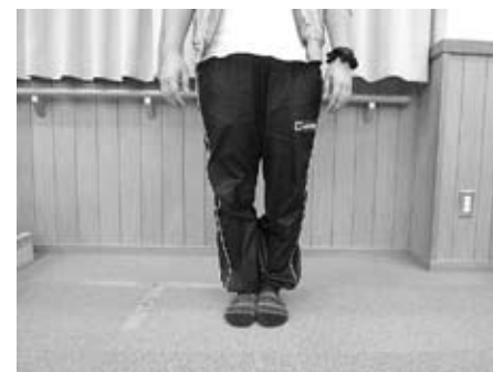
①つま先を正面に向け、真っ直ぐ立ちます。