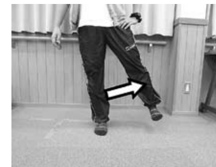
②片足をゆっくりと外へ開きます。