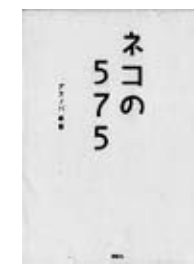
『ネコの575』デスノバ/著 講談社

「シティOL川柳大賞」の入選作、応募作を収録。オフィスでは出せない本音やヒミツがいっぱい!?