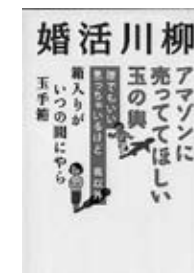
『婚活川柳』主婦の友社

イオンの総合ポータルサイト『イオンスクエア』が募集した「主婦川柳」「お買い物川柳」の投稿作品の中から選りすぐりを紹介します。