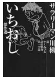
『サラリーマン川柳 いちおし傑作選』 NHK出版

ごぞんじ!第一生命「サラリーマン川柳コンクール」の応募作品から選ばれた優秀作360句を収録。