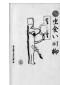
『虫食い川柳』角川春樹事務所

ギャグ系のものから、季語の織り込まれた味わい深い川柳まで、選りすぐりの757作品をお楽しみ下さい。