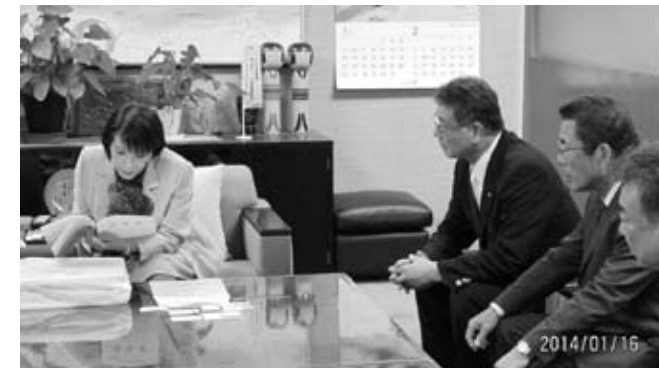
自由民主党 政務調査会長 高市早苗議員に陳情書を渡し確認の様子。