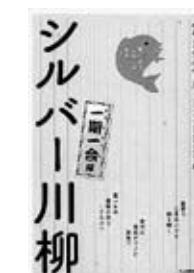
『シルバー川柳 一期一会編』河出書房新社

婚活している人はもちろん、その両親、婚活に関係ない人も思わず笑える川柳を多数収録。