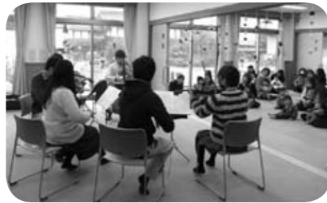
親子で一緒に演奏を聞きました。 美しい音色にウツリ！