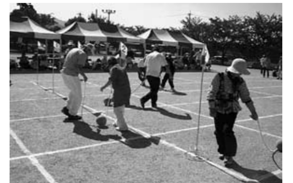
第6回「シルバー運動会」の様子