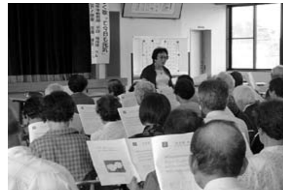
第3回「楽しく歌って今日も元気」の様子