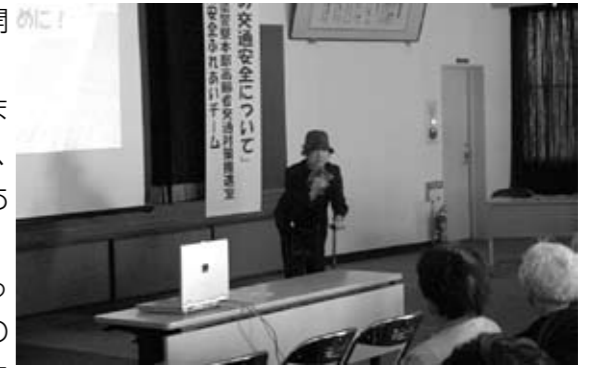
第1回「高齢者の交通安全」の様子