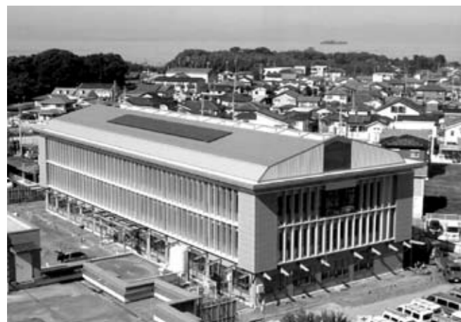
施設の外観 (11月末写真)

たとえ医療や介護が必要な状態になっても、長年住み慣れた地域で、自分らしく安心して生活したい。そんな皆さんの願いをかなえるための施設、それが彦根市保健・医療複合施設です。この施設は、保健と医療、福祉が連携し、一体的なサービスを提供するため、彦根市と愛荘町、豊郷町、甲良町、多賀町が共同で設置します。