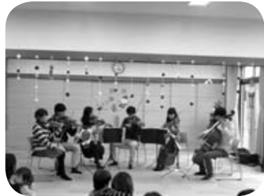
滋賀大学の オーケストラの皆さん

12月19日(木)の「ぽかぽかタイム」は、滋賀大学のオーケストラにミニ編成できただき、ミニコンサートを開催しました。当日は、併設している「ディサービスセンターかつらぎ」の利用者の方もお招きしました。美しい楽器の音色を聞いたあとは、おやつを食べて楽しく過ごしました。