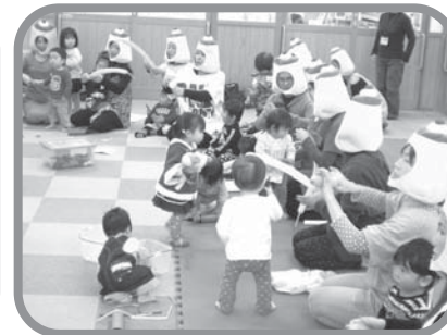
バルーンアートに挑戦! なにができるかな?