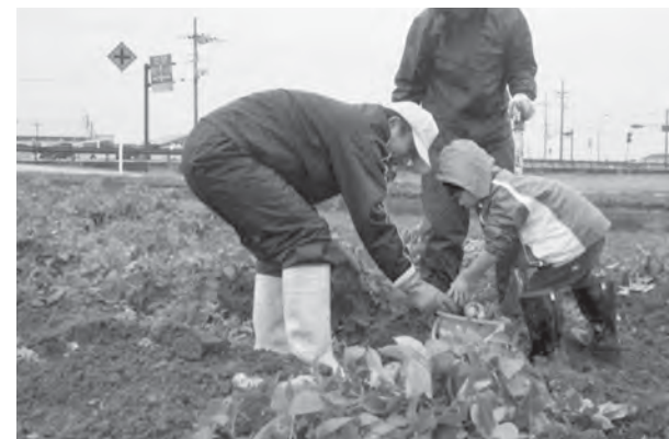
じゃがいも掘りの様子