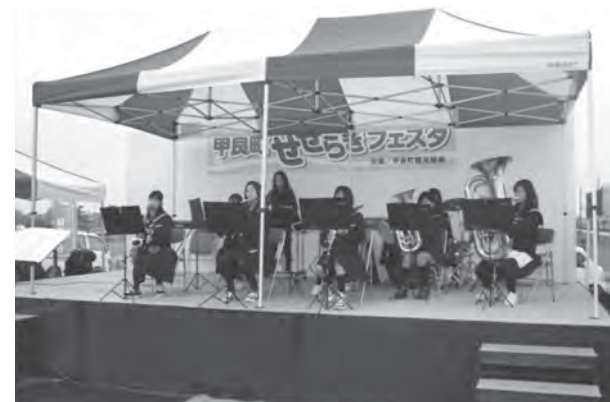
吹奏楽部の演奏風景