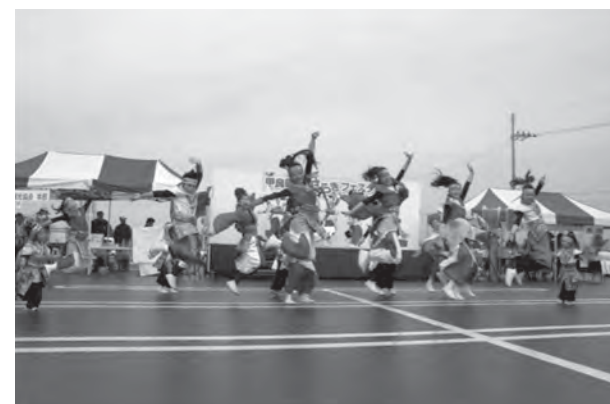
よさこいソーランの演舞