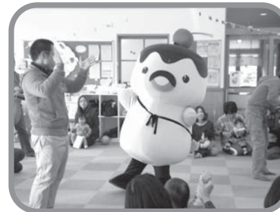
知ったかぶりんカイツプリンとプリンプリンダンスでごあいさつ