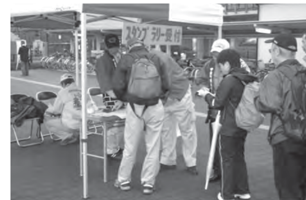
ウォーキング受付の場面