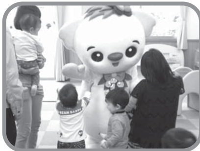
マスコットガール、ココラちゃん 子どもたちに大人気です!