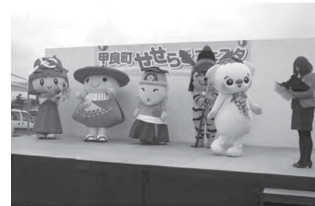
左から多賀・豊郷・愛荘・甲良のキャラクター