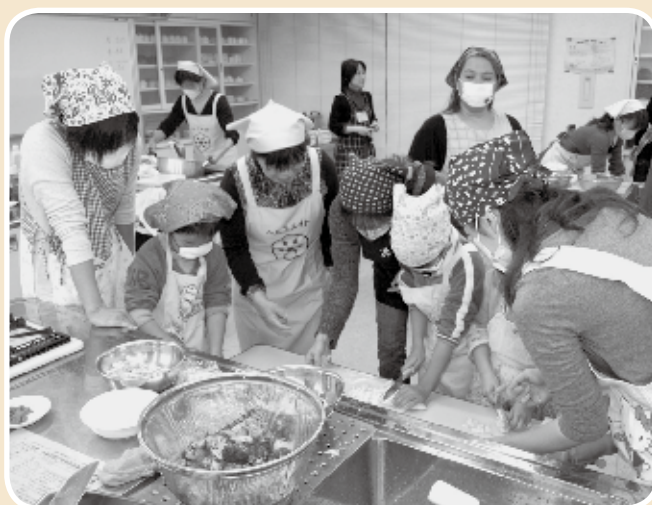
甲良東保育センターの様子（場所：保健福祉センター）