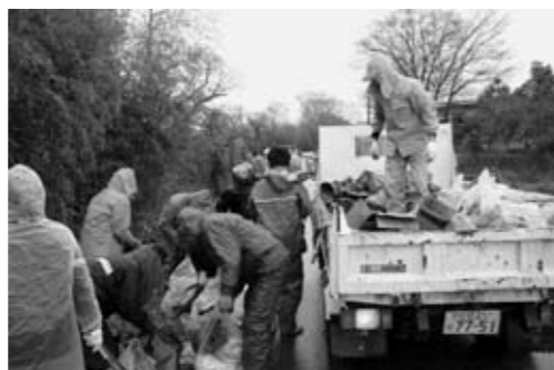
第12回犬上川クリーン作戦の様子

日時 3月6日（日）少雨決行 集合場所 北落工業団地 北側道路 お問合せ 甲良町 住民課 ☎38-5063