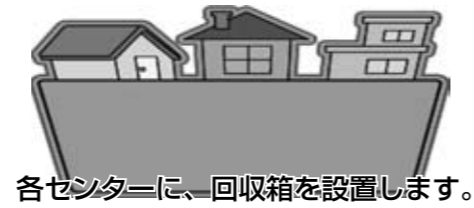
各センターに、回収箱を設置します。