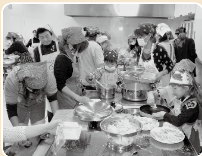
甲良西保育センターの様子（場所：呉竹地域総合センター）