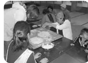
初めてのそばづくり

日本人同士でも色々な国の人とでも上手くコミュニケーションができるまでは大変ですが、皆と仲良くできたら、もっと人生は楽しく感じるでしょうね。多文化共生がうまくできる地域はやはり地域の人々が人間の一人一人のよさを認める地域だと考えられます。大好きな甲良町は日本人か外国人の地域ではなく、人間一人として幸せに感じて生きている地域になってほしいです。甲良町なら、絶対できることです。