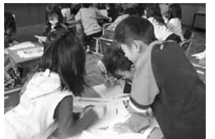
日本のものか、外国から来たものか、考えている子どもたちの様子