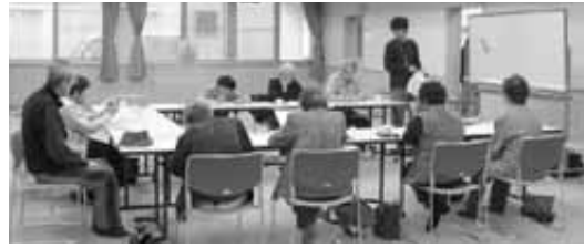
かむカム教室の様子