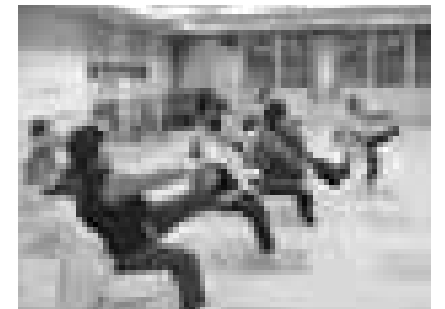
(正楽寺ボール体操教室)

参加者の希望に沿って、運動できる仲間づくりと地域の交流を交えて運動活動支援をしています。年3回運動指導士を派遣し、体力測定・運動指導・運動ビデオ作成を行います。