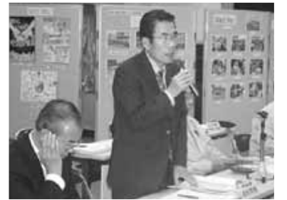
北川町長あいさつ

審議会では、第1回審議会で事務局が説明した「基本構想」について、委員からいただいた意見をもとに作成した「基本構想修正案」について、事務局の説明後に審議が行われました。審議では、甲良町の50年後、100年後を展望するためには、戦後65年ぐらいに甲良町がどのような変化を遂げ、その功罪はいかなるものなのかなどについて、意見が交わされました。今後、事務局(総務課)が第2回審議会での意見を総合的に調整、整理したうえで、基本構想(案)の作成を行うことになりました。第3回審議会は、1月中旬に開催を予定しており、基本構想に基づく基本計画について審議されます。