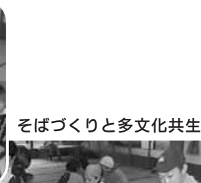
そばづくりと多文化共生