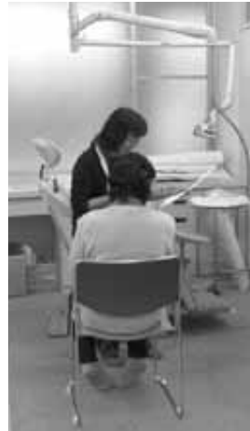
(お口の中をチェック)