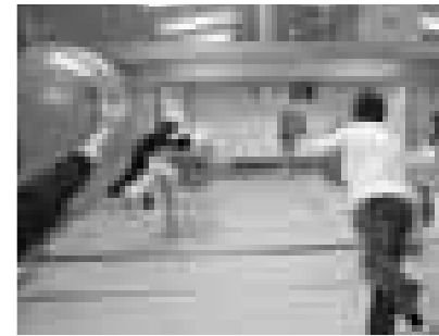
(池寺ボール体操の風景)