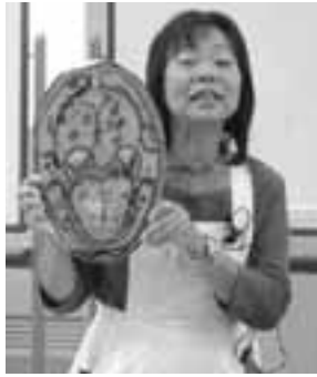
(歯科衛生士による講義)

歯と口の健康を守ることは、全身の健康に関係します。話すこと・食べることは普段当たり前の様に行っていますが、歯や口の手入れをしっかりとしないと、その当たり前のことすらできなくなってしまいます。毎日しっかりと歯磨きをし、定期的に歯科に受診し口の健康を維持しましょう。