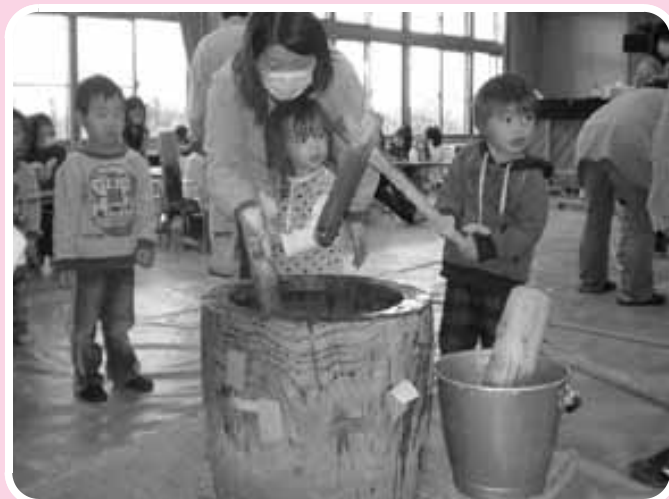
甲良西保育センター