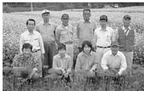
そばの花と彼岸花

また、9月下旬からは、一面に咲くそばの白い花と彼岸花のすばらしい景色が広がります。