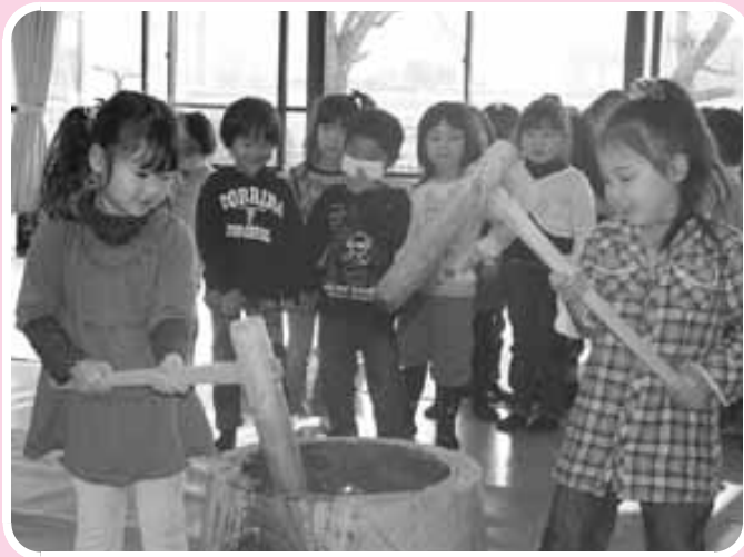
甲良東保育センター