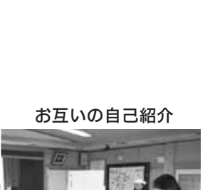
お互いの自己紹介