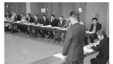
あわら市役所にて