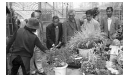
ファームビレッジさんで花の苗を見学