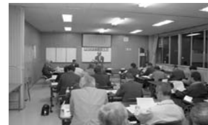
第1回甲良町まちづくり協議会

第2種兼業農家(農業以外の収入が主)が存在するのは、日本だけ。今、世界的な不景気だが、これから10年ぐらいは続くだろう。この10年間にどのように暮らし、次の世代に受け渡すのかが大切な視点であり、グリーンツーリズムなど農業や農村がもつステキな魅力で産業や雇用が生まれることが求められると語られました。