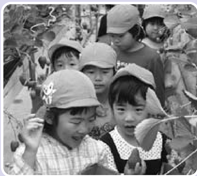
"川村農園サン" いつも甘～いイチゴをありがとう。 (5月13日)