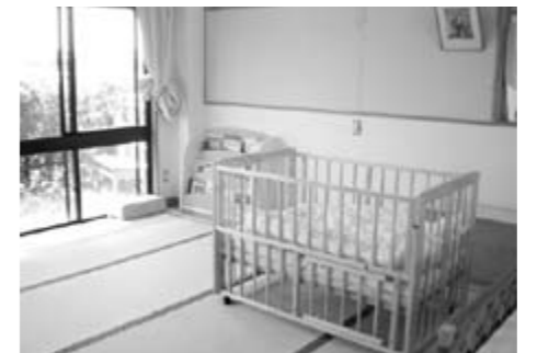
赤ちゃんのベッドも完備