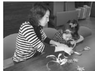
こうするのよ。分かったのかな？