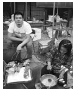
おいしいタイ料理をそろそろできあがり！