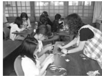
皆さん、上手ですね。