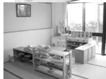
明るいスペースで安心して遊べますよ

詳しいお問い合わせは.. 東保育センター 38-2087 教育委員会 38-5070 子育て支援センター 38-8003