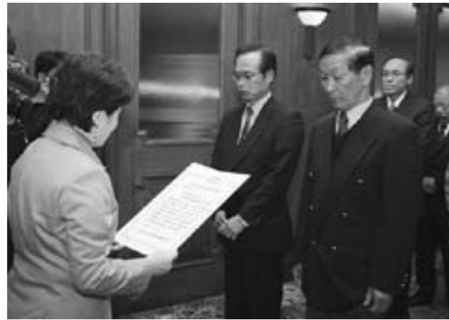
嘉田知事より認定書の交付