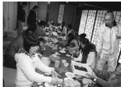
お互いの料理を楽しむ、これこそ多文化