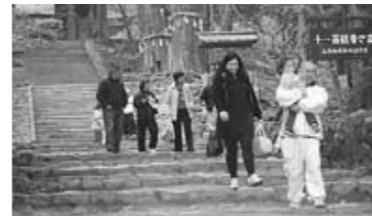
西明寺の庭園を歩く