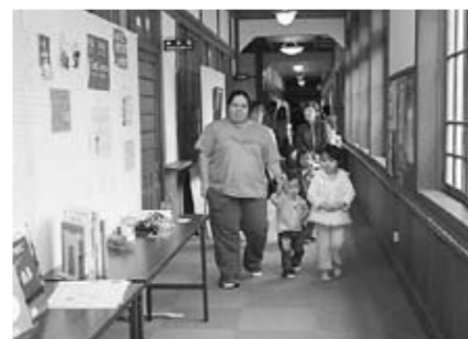
図書館の絵本ルームでおおはしゃぎでした。