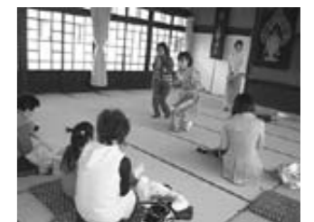
タイの挨拶で始まりました。