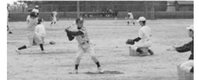
ソフトボールを使用しての打撃練習

日頃とは違う練習内容に戸惑いがあったかもしれませんが、スポ少野球と中学野球の違いを体感したことで、改めて野球の楽しさと厳しさを感じとったことでしょう。