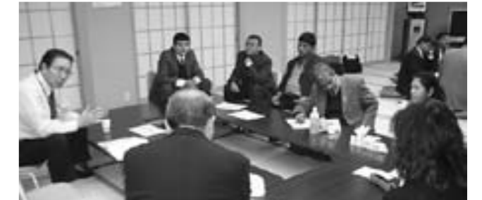
夜は熱心な討論会