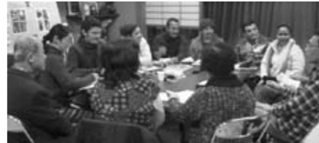
在士住民との意見交換会

研修員と在士住民との意見交換会では真剣な話し合いが行われ、最終日の交流会では、歌有り、踊りありとラテンのにぎやかさにつつまれました。