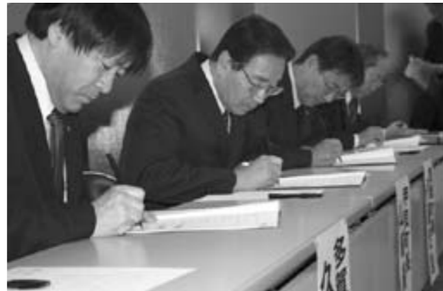
協定書に署名をする (手前から) 多賀町長、甲良町長、豊郷町長、愛荘町長

今後は商工会加入各社に呼びかけ、実際に災害時に提供できる人的物的支援をリスト化して、災害への備えを進めていきます。