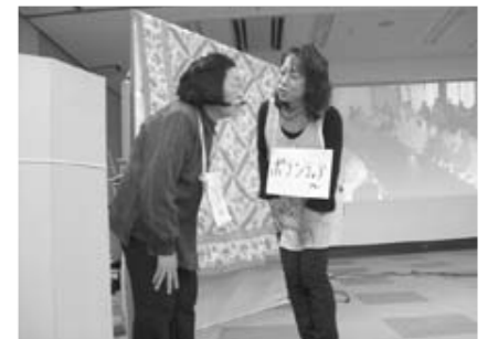
寸劇を熱演する甲良町キャラバンメイト

※介護予防事業などに関するお問い合わせは、地域包括支援センター ☎38-5161 まで