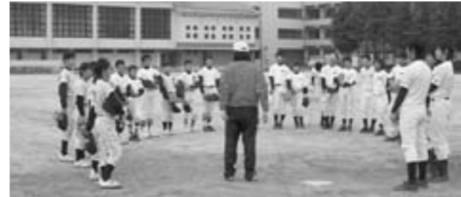
指導者の指示を聞くスポ少参加者