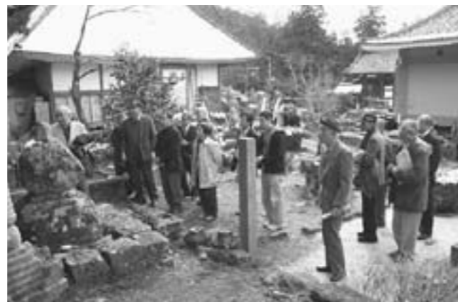
佐々木道誉の墓石前で説明を聞く一行