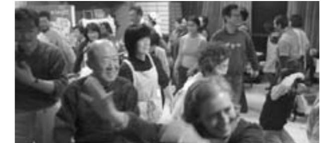
交流会の仕上げは江州音頭