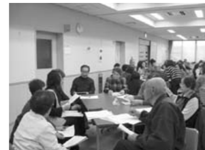
ワークショップ風景

「ワークショップとは」・・・参加者が自ら参加・体験し、グループの相互作用の中で何かを学びあったり創り出したりする、双方向的な学びと創造のスタイルのこと。