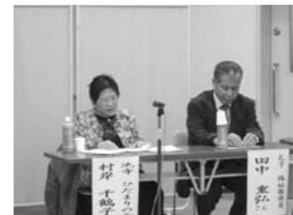
実践報告をする2人