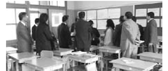
東小の取り組みを見学

そんなネパールから、これからのまちづくりには社会的に仲間はずれにされていた人(女性やダリットと呼ばれる差別されている人たち)の参加が必要と『人権のまちづくり』をテーマに甲良町の経験を聞きに来られました。