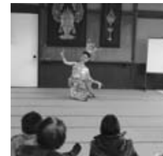
ジュラーラットさんとタイ舞踊