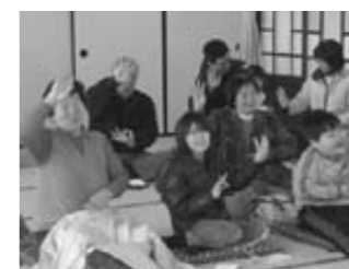
甲良町の皆さんはタイ舞踊体験