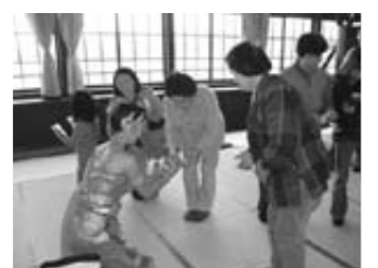
皆さんにタイからのお土産