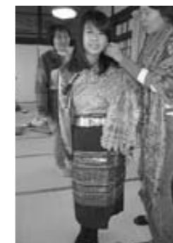
タイの女の子になりました！