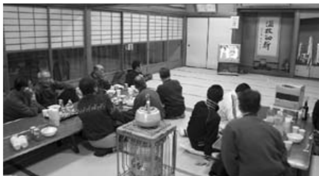
公民館に集まって紅白を見て新年を待つ区民