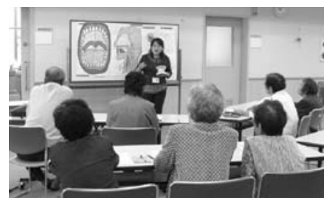
「歯科衛生士の先生からの講義～口のはたらき」

自分の口の中の状態を確認したり、咬合（かむ）力判定ガムを使って自分がどの程度噛めているかの確認もしました。