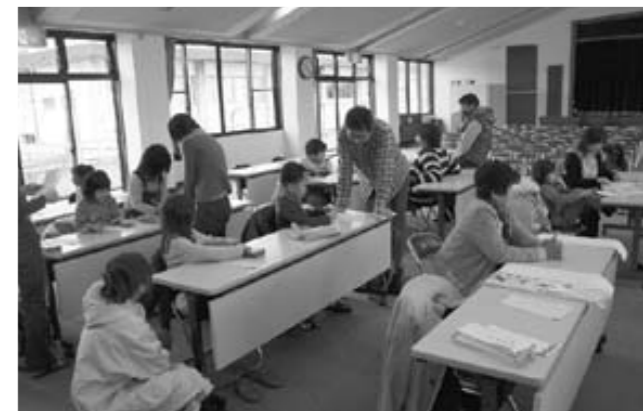
お父さんやお母さんも応援しています。

甲良町公民館において、甲良町文化協会主催の「新春書き初め大会」が行われ、参加した24人の子も達は毛筆と硬筆に分かれ、一心に新年の筆を走らせていました。