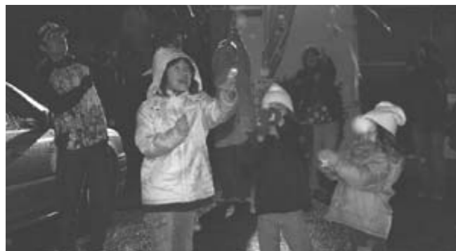
雪とクラッカーのテーブルが舞い落ちる年明け