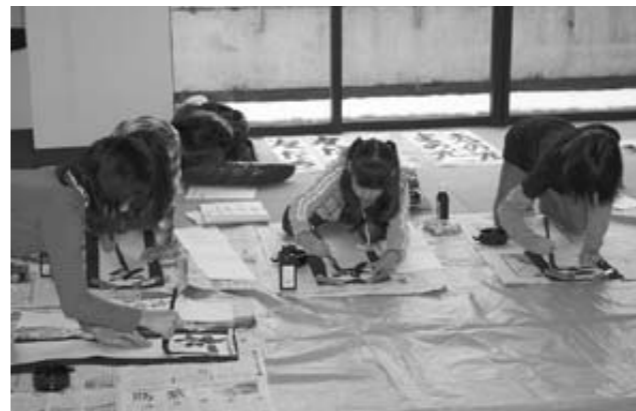
今年の書き始め。どうかな？

甲良町公民館において、甲良町文化協会主催の「新春書き初め大会」が行われ、参加した24人の子も達は毛筆と硬筆に分かれ、一心に新年の筆を走らせていました。