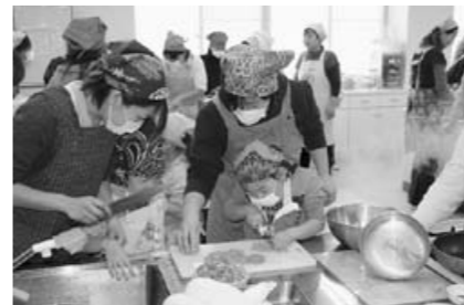
包丁持って人參切り

い、その横で親はハラハラドキドキしながら。でも、仕上がりは上々食事の時は、自分たちで栽培した野菜を使って、自分たちで作った料理の味は格別のようなでした。