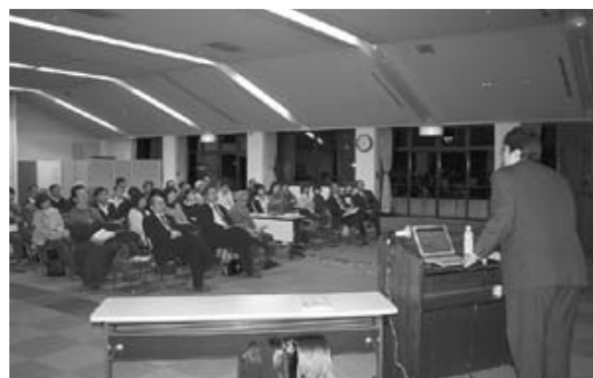
ブータンの魅力に興味を持って聞き入る参加者