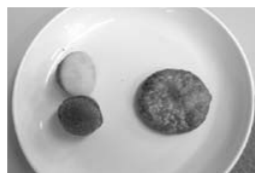
「たべやすいのは、どっち？」