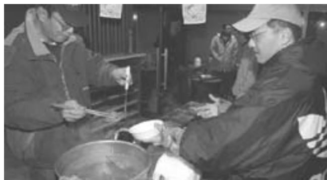
年越しおでんはいかがですか？

雪がちらつく中、「寒〜い」の一言から始まった、今回で2回目となる在土カウントダウン。