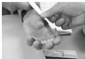
～入れ歯の磨き方～ 「しっかりと汚れを落としましょう」

～介護予防は、自分らしくいきいきと生きていくために、生涯を自立して暮らせる支えになることを目指して行うものです。これからの人生の目標に合わせ、介護予防を実践していきましょう。～