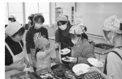
お皿に盛りつけましょう。出来上がり