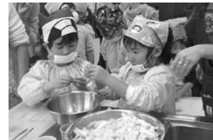
キャベツを手でちぎる