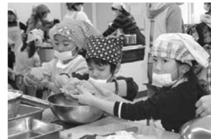
ハンバーグのタネをモミモミ