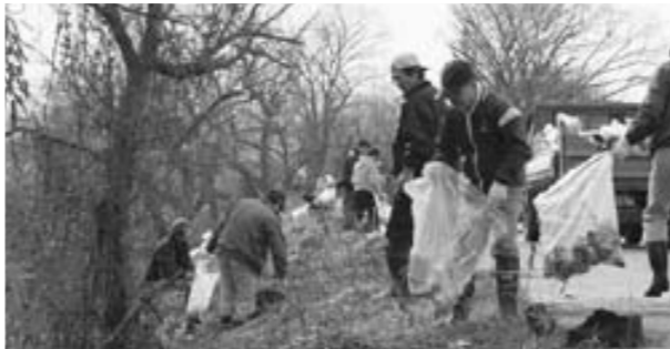
第10回犬上川クリーン作戦の様子