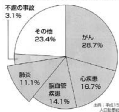
●65歳以上の死亡原因では肺炎が多い

自分の口の中の状態を確認したり、咬合（かむ）力判定ガムを使って自分がどの程度噛めているかの確認もしました。