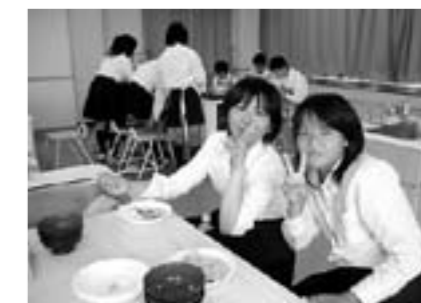
タイ料理、食べていますよ。