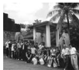
最終日ホテル前で記念写真