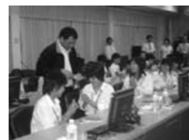
タイ内務省からプレゼント