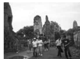
世界遺産アユタヤ遺跡を見る

建物のちがい、言葉のちがい、料理のちがい、香りのちがい…。いろんなちがいを感じたことでしょう。