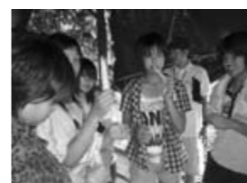
タイの竹の子を食する