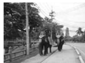
アユタヤで象乗り体験