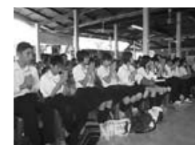
タイのお母さんの日イベントに参加