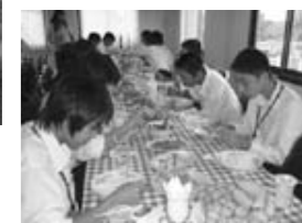
辛くないタイ料理ばかり。

私は、タイに行ってタイの文化について学びました。タイは、王様と女王様を大切にしています。タイの文化と日本の文化のたくさんの違いが知れてよかったです。