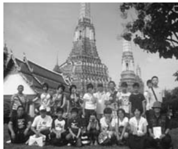
ワットアルン前で記念写真

8月7日から15日の9日間、海外派遣事業で甲良中学生15名が、微笑みの国、タイランドに行ってきました。