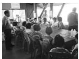
ドンバン町の小学生と交流