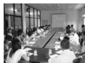
ポーガム村の説明