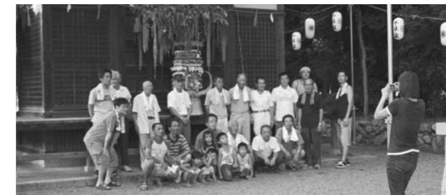
製作者や協力者などと記念撮影