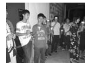
キャンドルセレモニーも 厳粛に