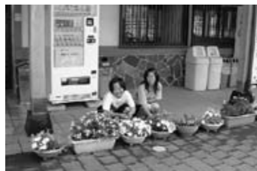
花のプレゼンターの生徒

この花のプレゼントを心待ちにしている人は、もうすぐ養護学校から花を届けに来てくれる時期を覚えているようで、最近の会話の中にも花の話題がでてくるようです。やっぱり花っていいですね。