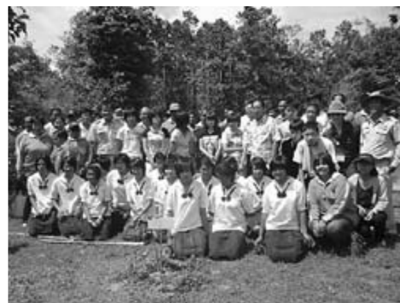
ドンバンの森で記念植樹

タイのバンコクの方は、都会ですごかったけど、田舎に移動したら甲良町に似ていて、ほっとしました。食べ物は少し食べれたし、充実した9日間でした。