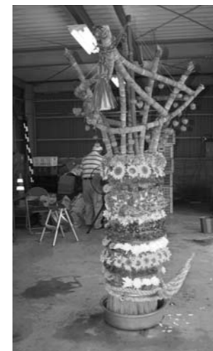
円柱を花で飾る (作業途中のヤッサ)

毎年8月7日の近い土曜日に金屋に昔から伝わる伝統行事の千草盆が行われました。カヤとチグサを集めてつくった円柱を花で飾り、さらに野菜で人形をつくって拝殿にお供えします。このつくり物をヤッサといい、今年は2体のヤッサが奉納されました。千草盆は現在8月7日本来の日に近い土曜日に行われています。