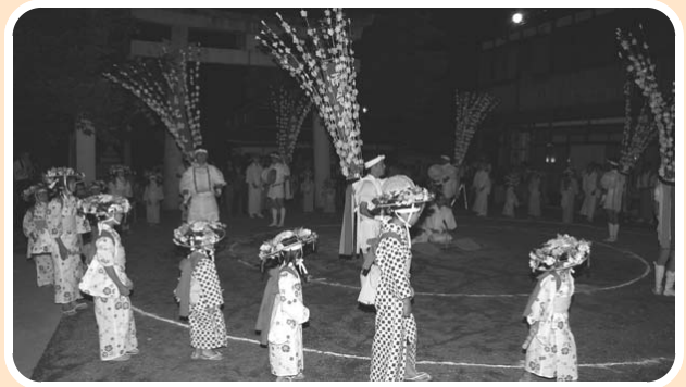
おはな踊りのはじまり