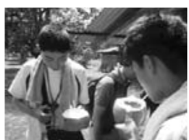
ココナツジュースの味は いかが?