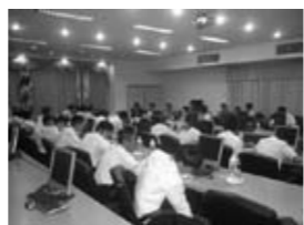
タイ内務省で歓迎を受ける