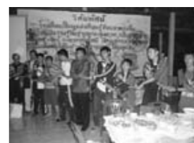
パーティもフィナーレ 手をつなぎあって。