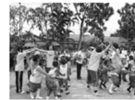
タイの遊びを体験