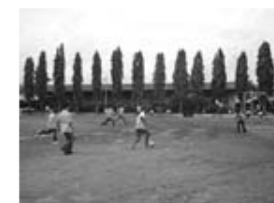
サッカーはタイの勝利