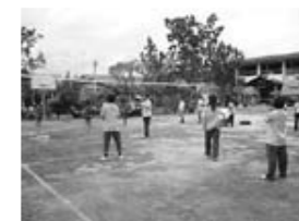
負けていない甲良のバレーボール