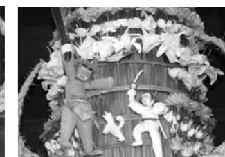
今年のつくりもん