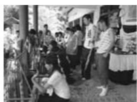
タイの楽器も演奏体験