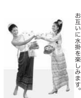
お互いに水掛けを楽しみます。