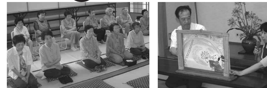
(小川原いきいきサロンより)

各字のいきいきサロンに出向いて、おはなし会をおこなっています。お気軽にお問い合わせください。