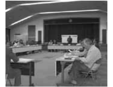
まちづくり協議会始まる

直売所の消費者ニーズが、安さより新鮮さを求めていることや農業を活かしたまちづくりのポイントでは、農産物で売れるものを作るだけではなく、農村がもつ次の世代に残さなければならない景観、地域の絆などを都市などの住民との交流によって一緒に守ることが、大切と話されました。