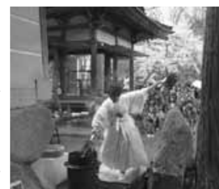
甲良町の祭りにも水掛けをしていますね。

タイのこと、 タイの文化、 タイ料理など に興味がある 方は気軽に連 絡くださいね。