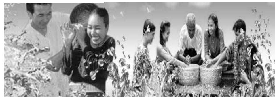
年下の人は年上の人の手ひらによい香りのする水を注ぎます。

参考: http://www.thaiembassy.jp/culture/songkran/index.html , http://www.songkran.net/th/