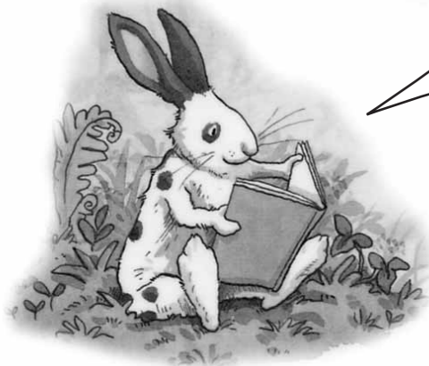
イラストカット/ 「ぼくはぼくのほんがすき」 アニタ・ジェラーム さく