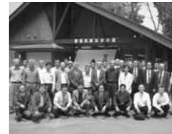
曾爾高原で集合写真