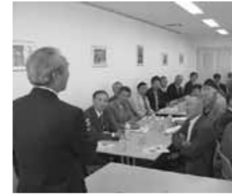
細田社長の熱心な話に耳をかたむける