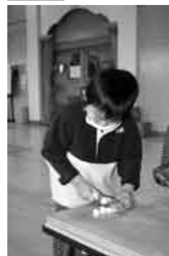
上手に大根切れるんだ(^_^)v

園児たちがちゃんこ作りに挑戦しました。食べやすい大きさに野菜を切る作業と、できあがったちゃんこを食べる作業をしました。鍋の中はいろんな顔（・・・）、形をした野菜が一杯で、風邪も吹き飛ばす栄養満点のちゃんこ鍋ができあがりしました。具材を口に運ぶと「おいしい——！！」の言葉がこぼれ、みんなと楽しい雰囲気の中での「ごちそうさま」となりました。