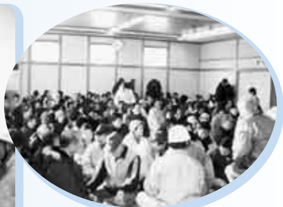
農事集会所へ避難