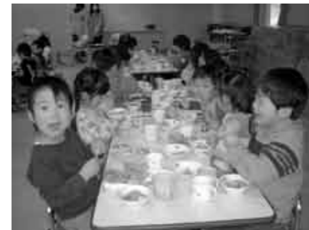
おいしい！おいしい！ハフハフハフ

園児たちがちゃんこ作りに挑戦しました。食べやすい大きさに野菜を切る作業と、できあがったちゃんこを食べる作業をしました。鍋の中はいろんな顔（・・・）、形をした野菜が一杯で、風邪も吹き飛ばす栄養満点のちゃんこ鍋ができあがりしました。具材を口に運ぶと「おいしい——！！」の言葉がこぼれ、みんなと楽しい雰囲気の中での「ごちそうさま」となりました。