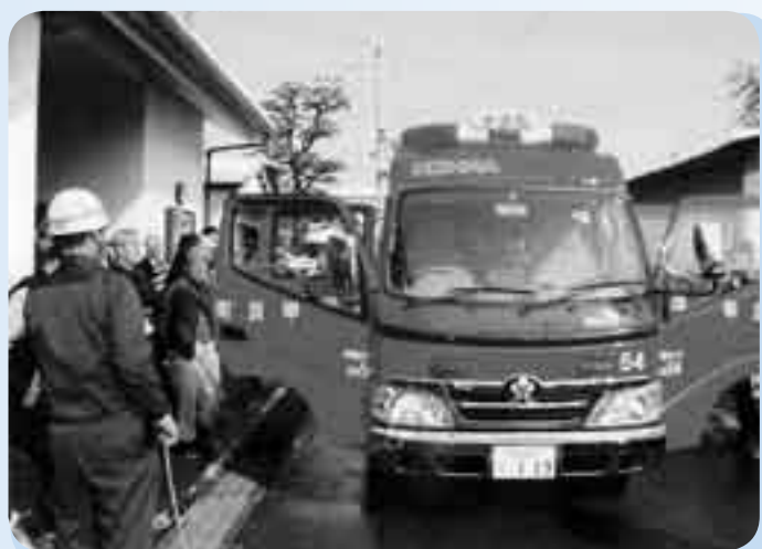
新しく購入した消防自動車の説明