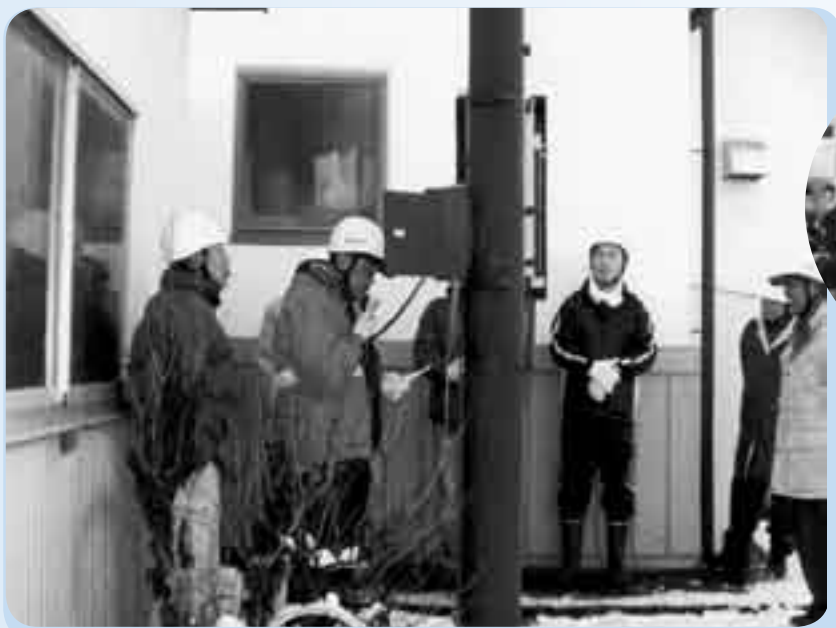
区民へ避難の呼びかけ