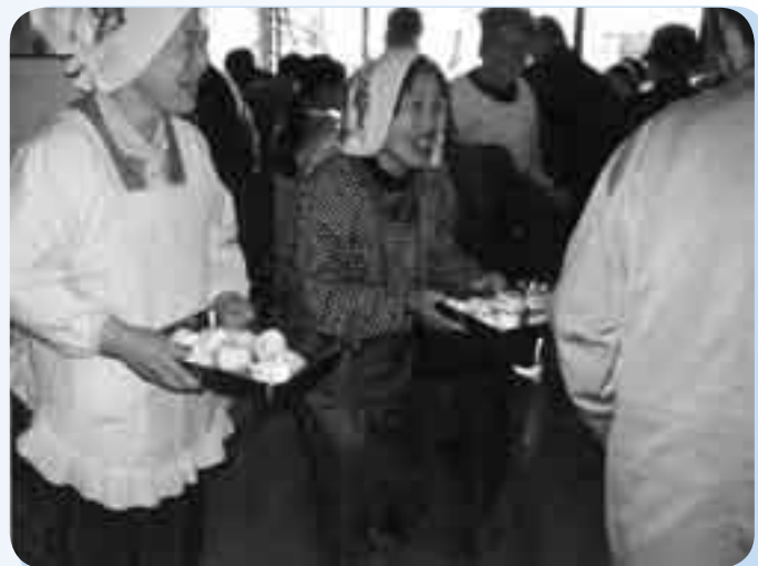
日赤の炊き出し(温かいおにぎり)