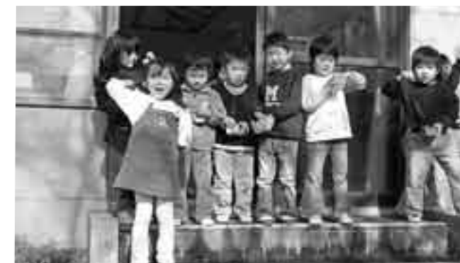
鬼はそと！福はうち！