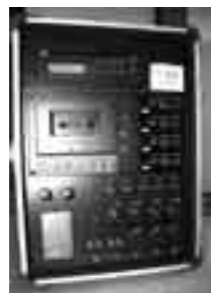
ワイヤレスイベントアンテナとワイヤレスチューナー

横関区がコミュニティ事業に活用する備品（テレビ、DVDレコーダー、パソコン、音響機器）を、宝くじの助成金（一般コミュニティ助成事業）で整備されました。