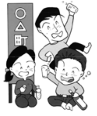
各種会合へのご祝儀