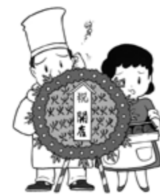
開店祝の花輪やお祝い