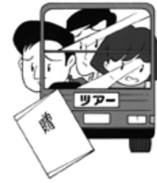
親睦旅行への差入れ