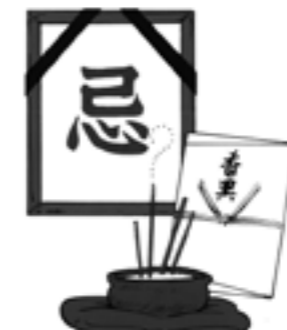
葬式の花輪や香典