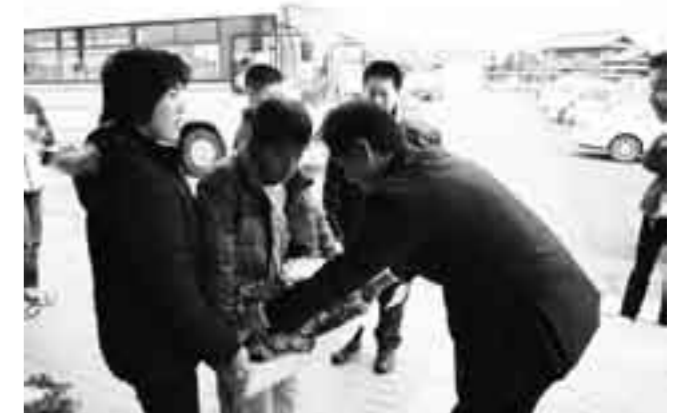
葉ボタンを手渡す養護学校の生徒達

美しく元気に育った葉ボタンを手渡してくれる生徒達からメッセージとともに葉ボタンを受け取った町教育委員会職員は、プランターと一緒に、生徒達の一杯詰まった温かいメッセージを受け取りました。