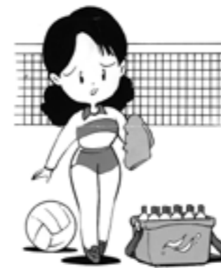
ママさんバレーや野球大会への差入れ