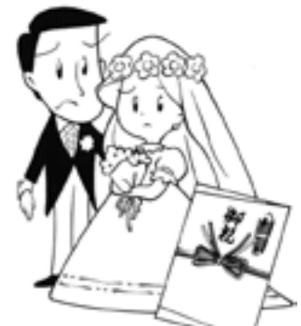
入学・卒業・就職・結婚・出産などのお祝