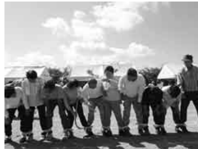
大きな笑い声で埋め尽くされた運動会の風景