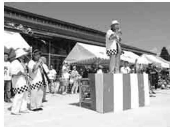
颯爽と音頭を取る捨丸会の皆さん

今までは機械からの声での江州音頭でしたが、今年は甲良のプロに力を借りての音頭となり、多くの児童や家族が踊りました。参加者も、心地いい太鼓と声色に気持ち良く余韻まで楽しんでいました。