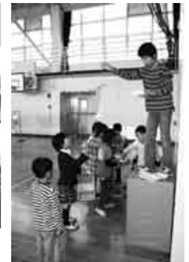
豊郷町あすなろ園での職場体験（甲良西小6年）