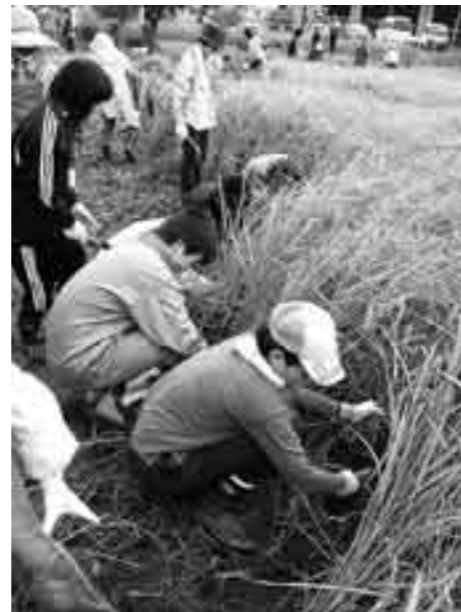
学校田での刈り取り作業（甲良東小5年）