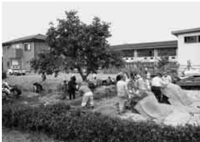
甲良養護学校生徒と町民との稲刈り