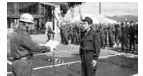
▲自警団員永年勤続表彰

日頃から、万一の災害に備えるのは大変なことです。訓練の積み重ねがいざというとき身を守ることになります。大規模な災害が発生すると、一人だけでは対応しきれないが増えます。住民の皆さまも日頃から身の回りの点検をするなど、少しずつ災害に備えるようお願いします。